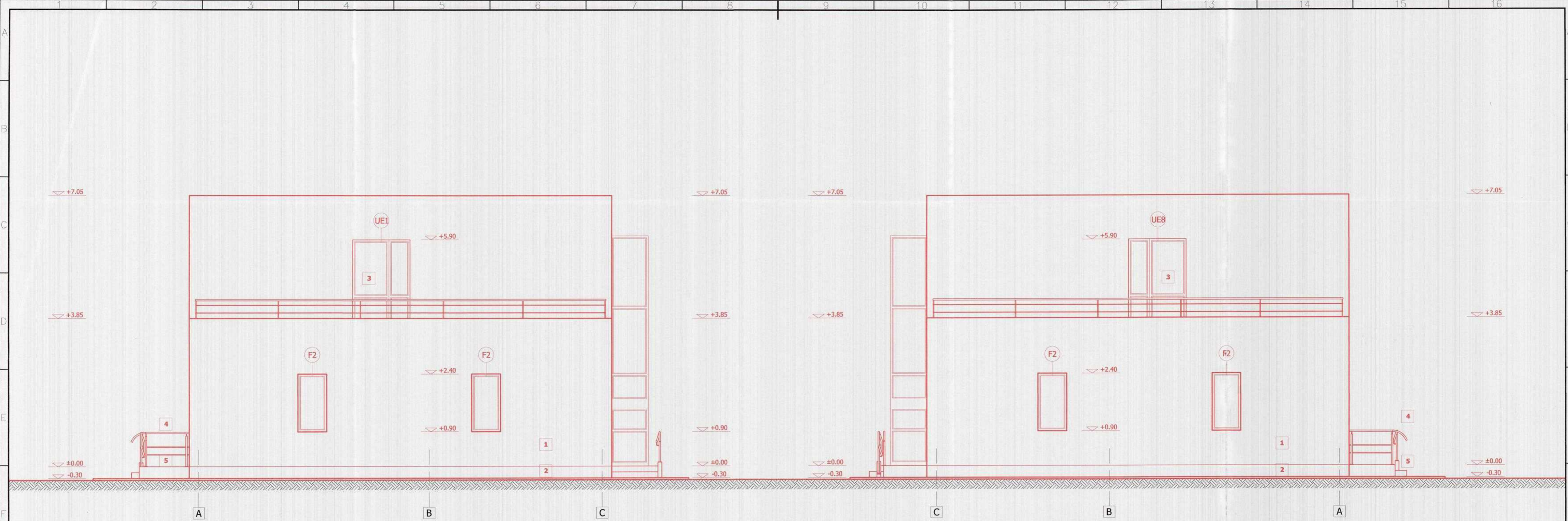
VEDERE LATERALA DREAPTA